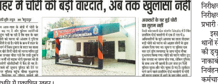
हरिभूमि में प्रकाशित खबर।