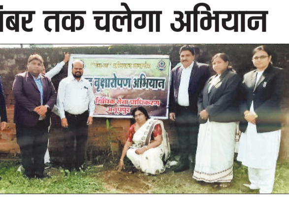
जिला न्यायालय परिसर में किया गया पौधरोपण।