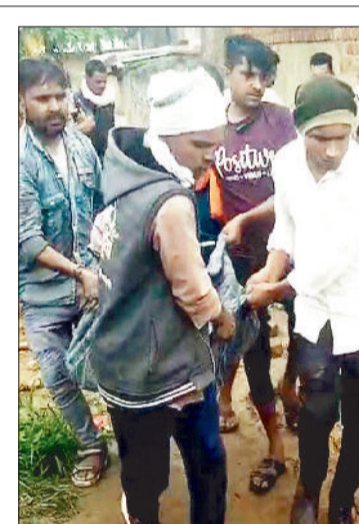
जले शव को बाहर निकालते लोग।