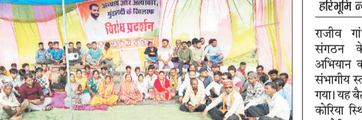
मंगलवार को कैलाशपुर में धरना देते सनातन गौरव मंच के लोग।