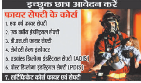
इस्युक छात्र आवेदन करें फायर सेफ्टी के कोर्स 1. एक वर्ष फायर सेफ्टी 2. एक वर्ष इंडस्ट्रियल सेफ्टी 3. बी.एस.सी. फायर सेफ्टी 4. सेनेटरी हेल्थ इंस्पेक्टर 5. एडवांस्ड डिप्लोमा इंडस्ट्रियल सेफ्टी (ADIS) 6. पोस्ट डिप्लोमा इंडस्ट्रियल सेफ्टी (PDIS) 7. सर्टिफिकेट कोर्स फायर एवं सेफ्टी

औद्योगिक सुरक्षा की नियुक्ति फायर स्टेशन, कारखाने, खदानों, माइनिंग, पावर प्लांट, कागो हब फैक्ट्री कारखाने सरकारी एजेंसी, इश्वोरस कंपनी एवं अन्य जगहों में फायर अधिकारी, ट्रेनर, फायरमैन, औद्योगिक सुरक्षा निरीक्षक, सेफ्टी मैनेजर, फायर सुपरवाइजर, टीम लीडर जैसे अन्य पदों हेतु अवसर मिलते हैं तथा भविष्य में पदोन्नति की भरपूर संभावनाएं होती है साथ ही फायर एवं सेफ्टी ऑफिसर स्वयं रोजगार के लिए समर्थ होते हैं अनुमानित जानकारी के अनुसार छत्तीसगढ़ राज्य में बने नए जिलों में अनुमानित लगभग 2000 पद फायरमैन एवं अग्निशमन वाहन चालक की भरतियां आने की