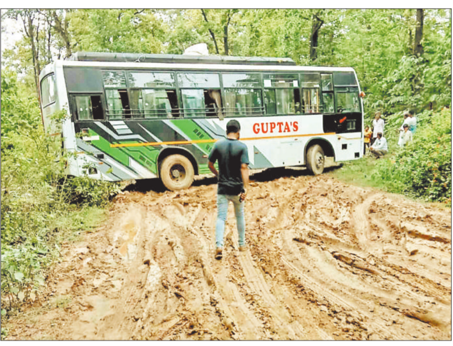
फिसलन भरी सड़क पर बस जैसे बड़े वाहन अनिश्चित होकर दुर्घटना का हो रहे शिकार, दोपहिया वाहन और पैदल चलने वालों का आवागमन हुआ मुश्किल।

बलरामपुर जिले के अंतर्गत आने वाली प्रतापपुर चलगली मार्ग की सड़क की हालत बेहद दयनीय हो गई है। खास बात आलम फंस रहे वाहन, पैदल चलना भी मुश्किल यह है कि इस मार्ग पर अब बसों का चलना भी बंद हो गया है और लोगों को चार किमी की यात्रा पैदल ही करनी पड़ रही है। हैरानी की बात तो यह है कि इस मार्ग पर ठेकेदार को पैच रिपेयरिंग और मरम्मत के कार्य का जिम्मा दिया गया लेकिन सिर्फ मिट्टी डालकर छोड़ दिया जिससे सड़क दलदल में तब्दील हो गई है और वाहनों में पहिए इस मार्ग पर धंस जा रहे हैं। इधर अधिकारी किसी भी प्रकार के मरम्मत कार्य से इनकार कर रहे हैं और पैच रिपेयरिंग के लिए शासन को प्रस्ताव भेजने का हवाला दे रहे हैं।