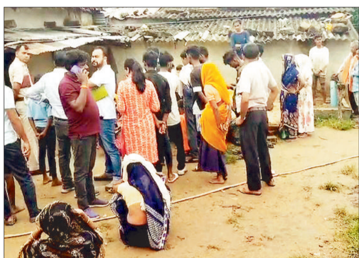
घटनास्थल पर लगी भीड़।

जिला मुख्यालय बैकुंठपुर से कुछ ही किमी की दूरी पर सिटी कोतवाली थाना क्षेत्र के एक गांव के मकान में आग लगने से पिता व मासूम पुत्र की संदिग्ध परिस्थितियों में दर्दनाक मौत हो गई। घटना की खबर से गांव में शोक की लहर फैल गई। पुलिस को सूचना मिलने पर मौके पर पुलिस के अधिकारियों के साथ फॉरेंसिक एक्सपर्ट भी मौके पर पहुंचे और घटनास्थल का बरिकी से मुआयना कर पिता पुत्र के शव को पीएम के लिए भेज दिया।